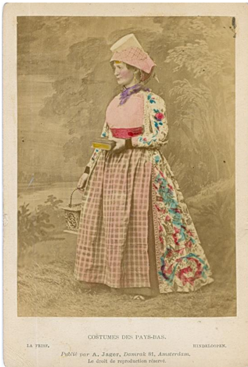
Costumes de Pays-Bas Hindeloopen