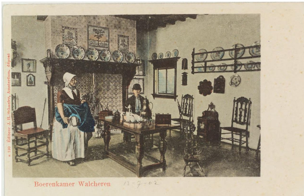
Editeur J.H. Schaefer, Amsterdam.