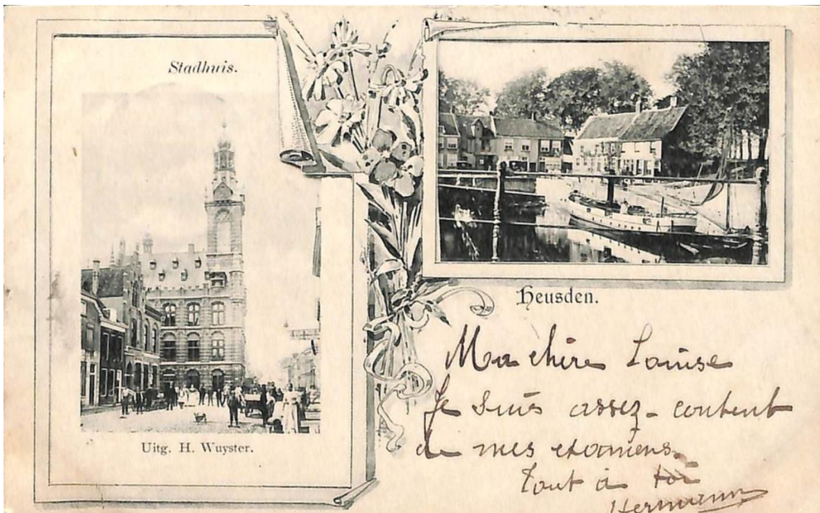
Uitg. H. Wuyster

De foto graaf van het Stadhuis van Heusden is de Utrechtse foto graaf Lodewijk Hendrikus Serré (1847-1897) op de achterzijde is een reclame gedrukt van de foto graaf L.H. Serré. Geschreven tekst op de achterzijde: Stadhuis te Heusden 8 Augustus 1899.