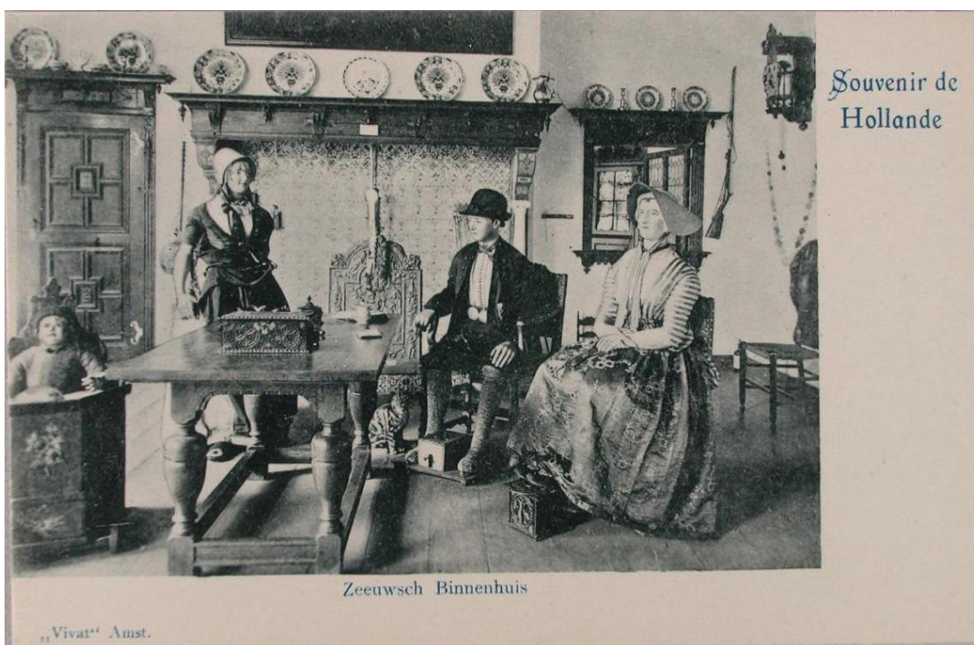
Uitgave Vivat, Amsterdam

Carl Wilhelm Bauer (1844-1911) is een fotograaf uit Middelburg en Vlissingen. Er zijn veel prentbriefkaarten omstreeks 1900 met een foto van het stadhuis uit ongeveer dezelfde positie, maar geen een is exact gelijk aan de harde foto. Tekst op de achterzijde: Veere. Stadhuis 21 Juli 1888.