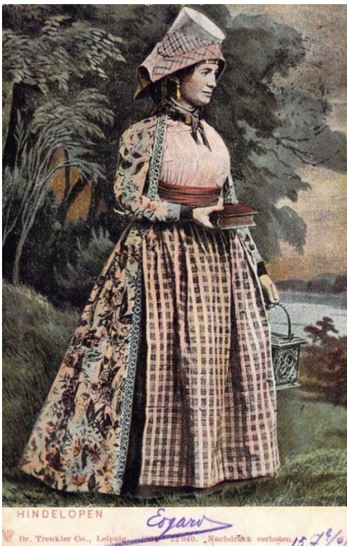
Dr. Trenkler Co., Leipzig.