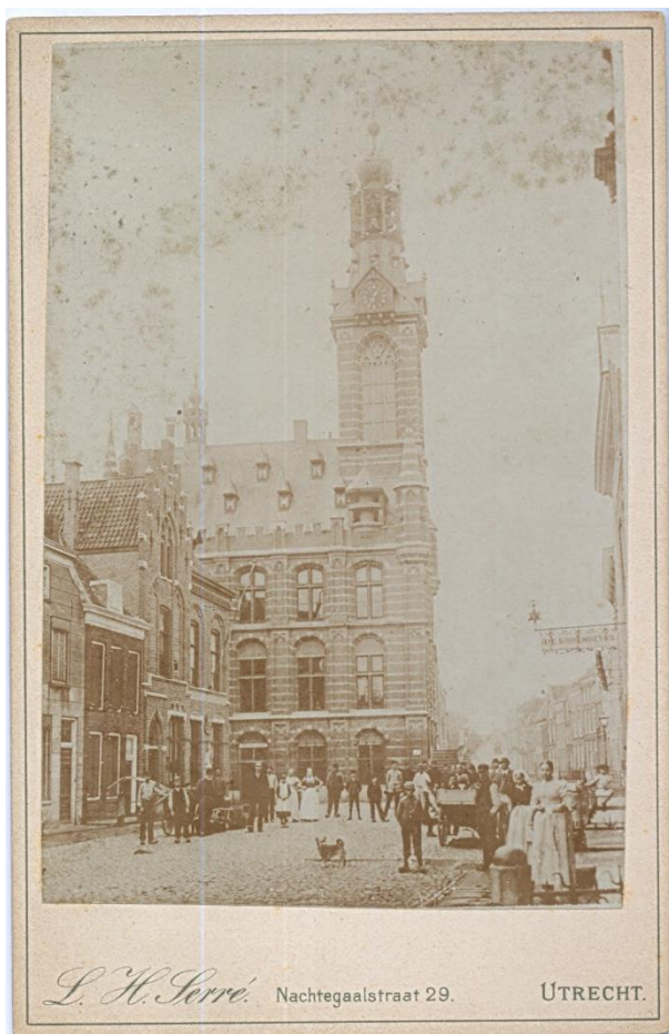
Stadhuis van Heusden