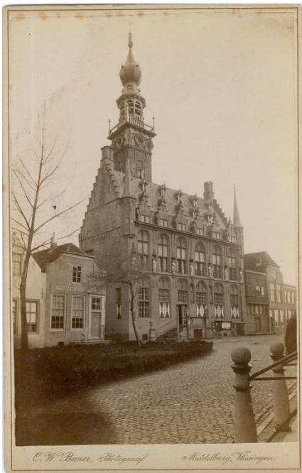
Stadhuis van Veere