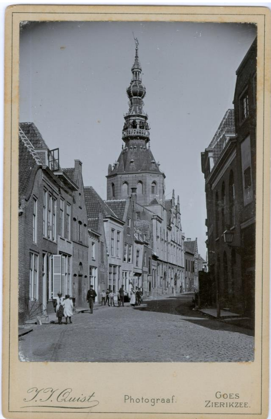
Stadhuis van Zierikzee