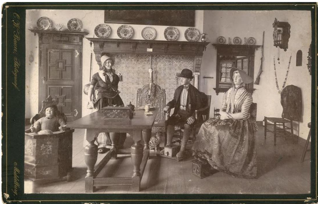
Walchersche Boerenkamer, Middelburg.