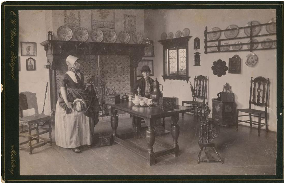
Walchersche Boerenkamer, Middelburg.